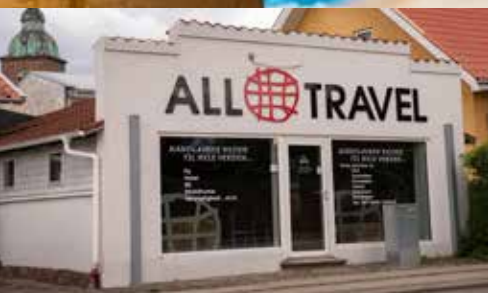
All-Travel, Nørre Trandersvej 27-29 www.all-travel.dk